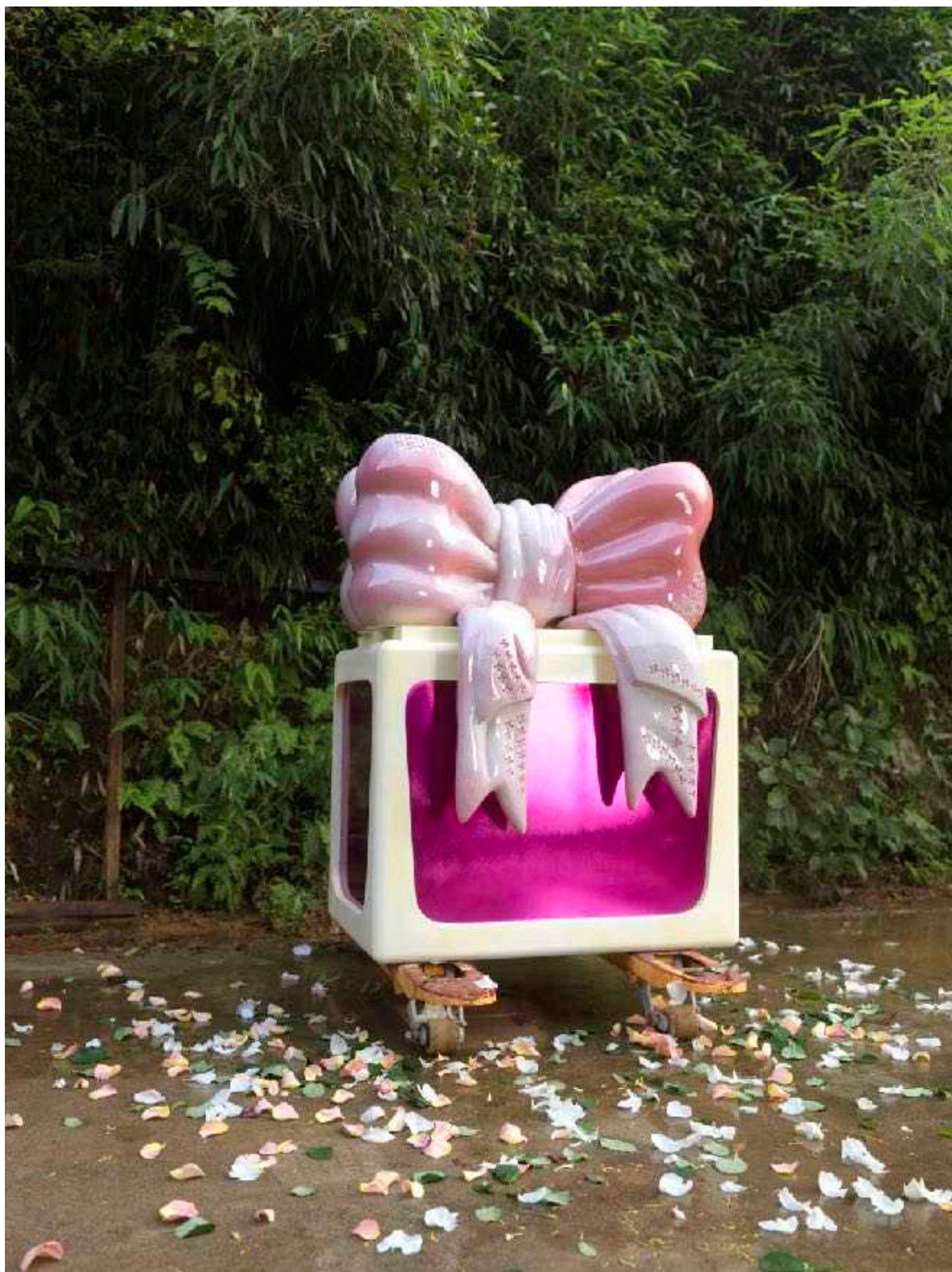
爱是礼物（Dior委托授权制作）

Love is a Gift (Commissioned by Dior for Miss Dior)